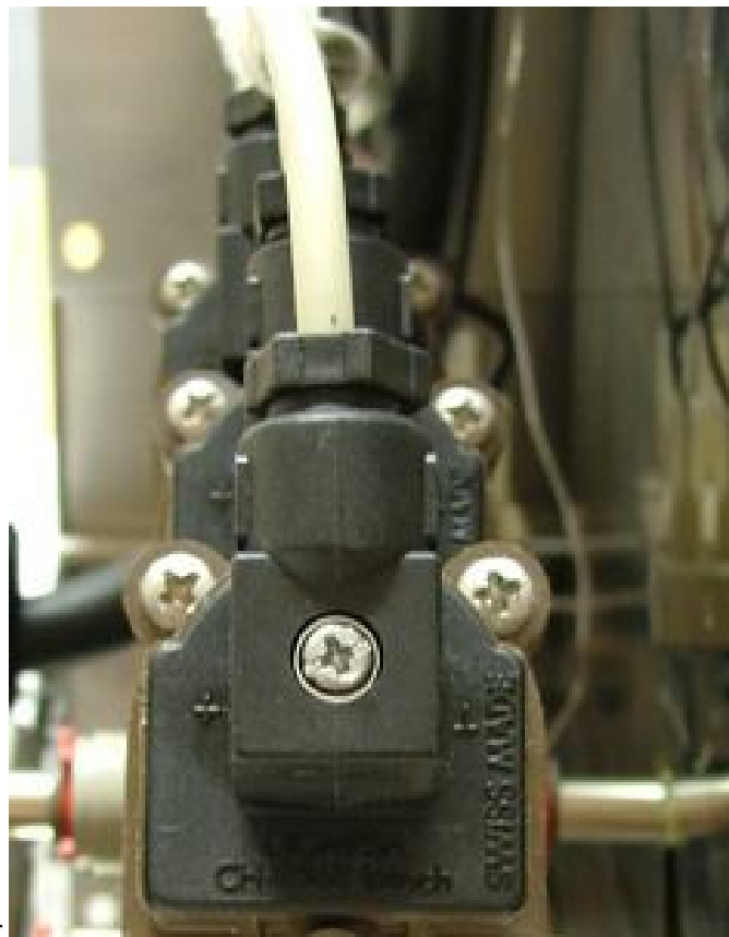
Abb.1: Digmesa – Geber