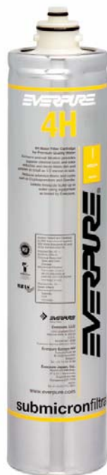
4H Filterpatrone: EV961100

Liefert Premiumwasser höchster Qualität für Kaffeeanwendungen