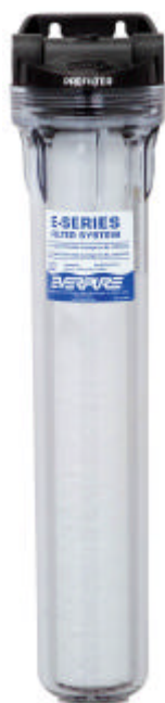
E-20 Vorfilter System 9795-90 EC210 Prefilter Patrone 9534-20

Vorfiltersystem für Anwendungen im Lebensmittelbereich